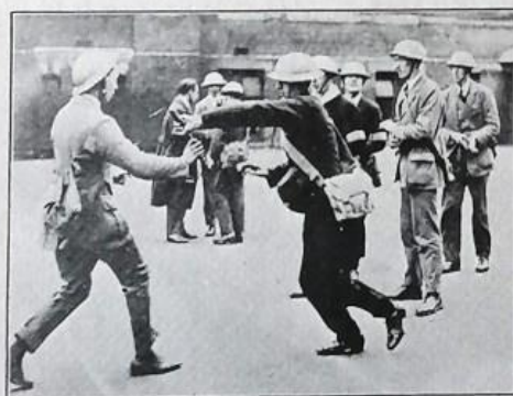
THE NEW CONSTABULARY RESERVE BEING INSTRUCTED IN DEFENCE AND ATTACK.