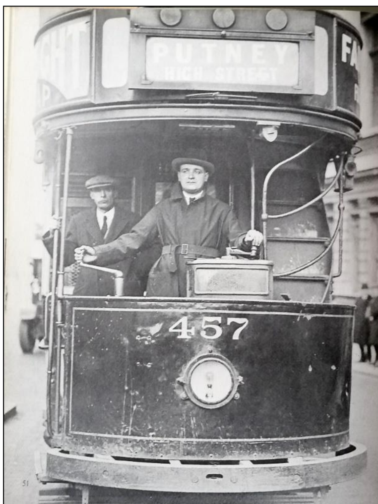
Un volontario presta servizio come crumiro alla guida di un tram

Anche i fattori interni furono importanti nel plasmare la politica del CPGB. Il partito ereditò due idee dal passato. Da un lato c'era l'atteggiamento sindacalista, che considerava i partiti socialisti come uno strumento di propaganda per l'attività puramente industriale. Dall'altro lato, molti ex membri del British Socialist Party portarono con sé nel nuovo partito l'idea che la politica non avesse nulla a che fare con i sindacati. Fino al Venerdì Nero del 1921[5], questi due fattori coesistevano nel partito e portarono ad una visione propagandistica del suo ruolo, sia politico che industriale.