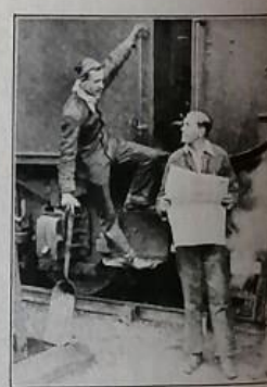
UNDERGRADUATES OILING UP AT KINGS CROSS PRIOR TO A RUN.

Depliant commemorativo dei volontari antisciopero