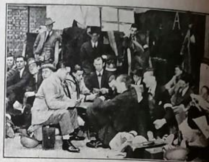
SPECIALS OFF DUTY WHILING AWAY THEIR SPARE TIME AT A LONDON DRILL HALL.