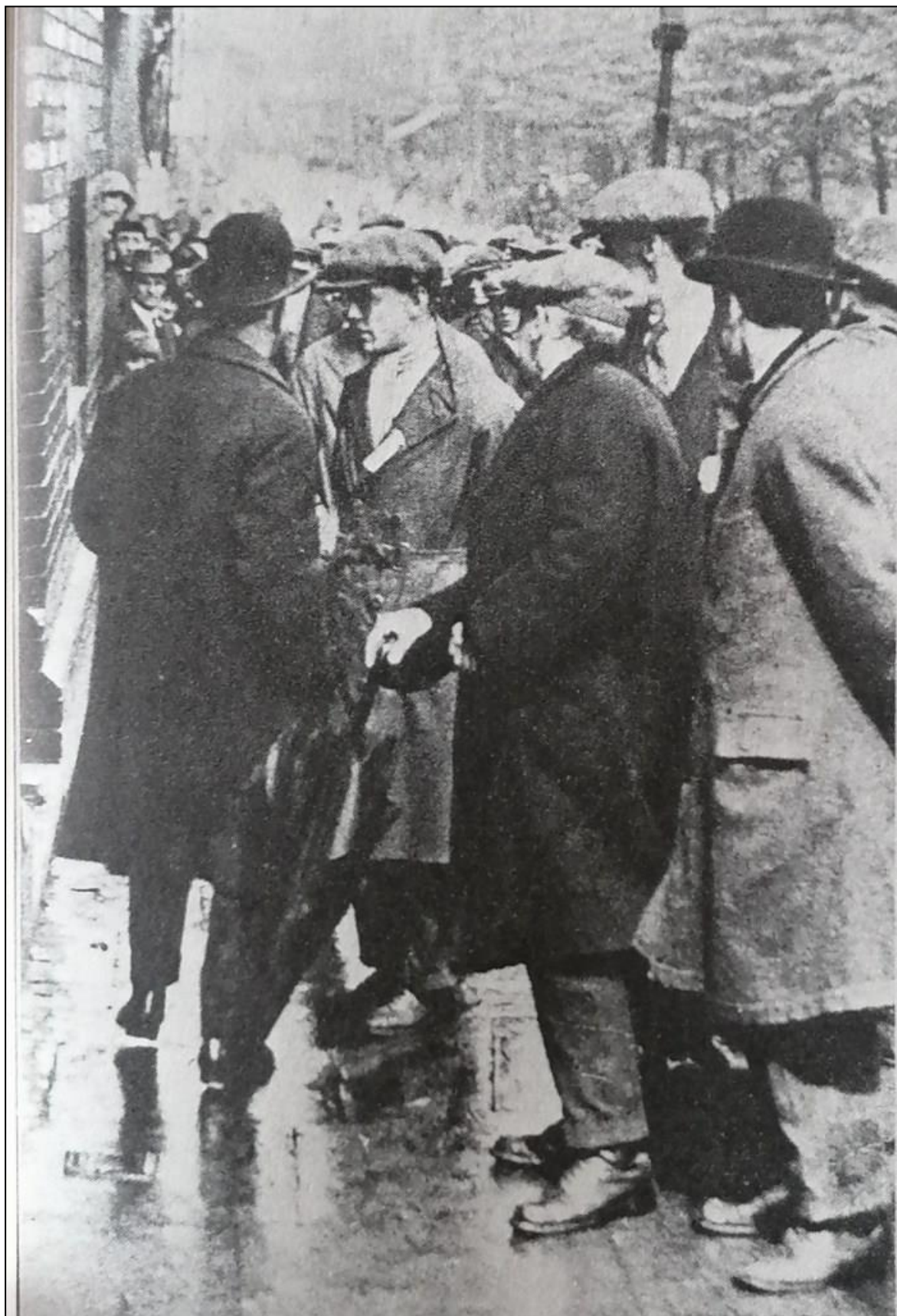
Un picchetto di lavoratori delle ferrovie intercetta un impiegato crumiro

all'opera. E tra queste è cruciale l'equilibrio delle forze di classe sul luogo di produzione e la coscienza politica della classe operaia.