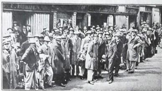
UNDERGRADUATE VOLUNTEERS AWAITING TRANSPORT AT OXFORD TO TAKE THEM TO THEIR TEMPORARY JOBS.

How all classes of the country came forward to perform national service.