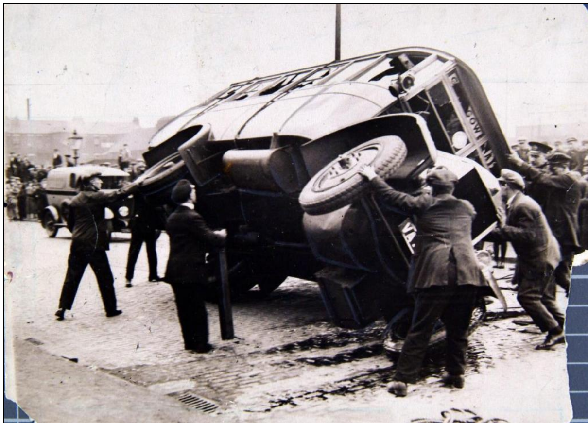
Lavoratori in sciopero rovesciano un autobus guidato da un crumiro

In una rivoluzione centinaia di migliaia, anzi milioni di persone vengono trascinate nella lotta e lo svolgersi degli eventi è determinato in modo decisivo dalla loro azione. I colpi di scena della lotta sono del tutto imprevedibili. Lo stesso non si può certo dire dello sciopero generale. Le sue linee generali – la data stessa del conflitto, il sostegno retorico iniziale dei minatori da parte del TUC, la determinazione del governo a smascherare il suo bluff e il tradimento calcolato – tutte queste cose potevano essere intuite dopo il “Red Friday”.