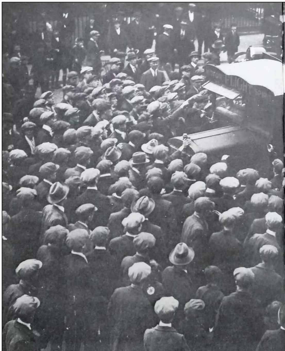
Un picchetto operaio blocca una consegna di merci

La verità è del tutto diversa. La serrata delle miniere, la persecuzione di massa degli scioperanti, i tagli salariali e l'allungamento dell'orario di lavoro furono un barbaro promemoria di ciò che il capitalismo è in grado di fare se i lavoratori glielo permettono. Le file per il sussidio di disoccupazione degli anni '30, ancora oggi ricordate con tristezza, ne furono il risultato. La generale passività dello sciopero rese la sua sconfitta e la demoralizzazione che ne seguì ancora più certe e fu il risultato deliberato delle politiche codarde della burocrazia sindacale. Non c'era nulla di particolarmente britannico in questo. I riformisti di tutto il mondo si sono comportati in modo altrettanto deplorabile (anche se di solito con minori effetti).