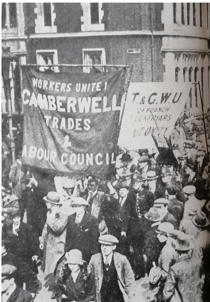
Manifestazione operaia durante lo sciopero

Il conflitto del 1926 fu ben reale. Lo sciopero coinvolse milioni di lavoratori; furono schierati l'esercito e la marina; le autoblindo percorsero le strade. Ma per giudicare se vi fosse un senso di insicurezza tra la classe dominante, è meglio confrontare i documenti di Gabinetto del 1926 con quelli del 1919–1920, oppure confrontare le annotazioni nei diari di Whitehall di Tom Jones, vicesegretario di Gabinetto, per lo stesso periodo. [...] nel 1919–1920 vi era tumulto nelle file del governo. Non troviamo nulla di simile nel 1926. Le dichiarazioni pubbliche del governo non riflettevano i suoi reali sentimenti e l'uso delle truppe era per lo più di facciata.