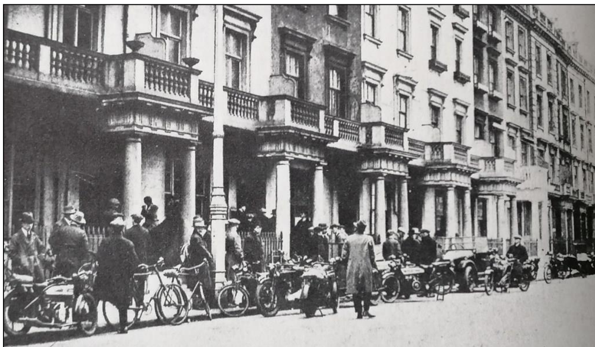
Volontari operai in bicicletta prestano servizio come staffette per i sindacati

La burocrazia agiva esattamente come una valvola di sicurezza su una caldaia. Se la pressione si accumula troppo, si apre e il vapore necessario viene rilasciato. Ma lo scopo di una valvola di sicurezza non è il rilascio di vapore, bensì impedire che la caldaia esploda.