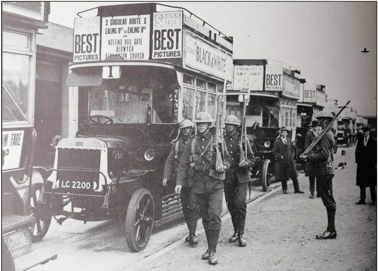
Soldati scortano autobus guidati da crumiri fino alle rimesse

[...] la chiave della burocrazia non sono i funzionari stessi, ma la situazione generale della classe operaia, e in particolare la sua coscienza di classe. [...]