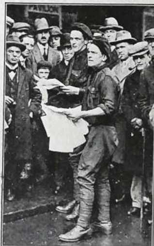
BRITISH FASCISTI DISTRIBUTING ANTI-STRIKE PROPAGANDA IN THE WEST END.