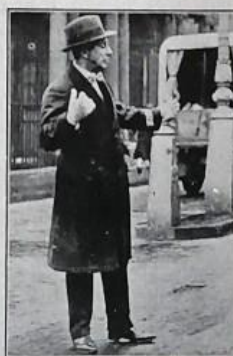
THE SPECIAL REGULATES STREET TRAFFIC.