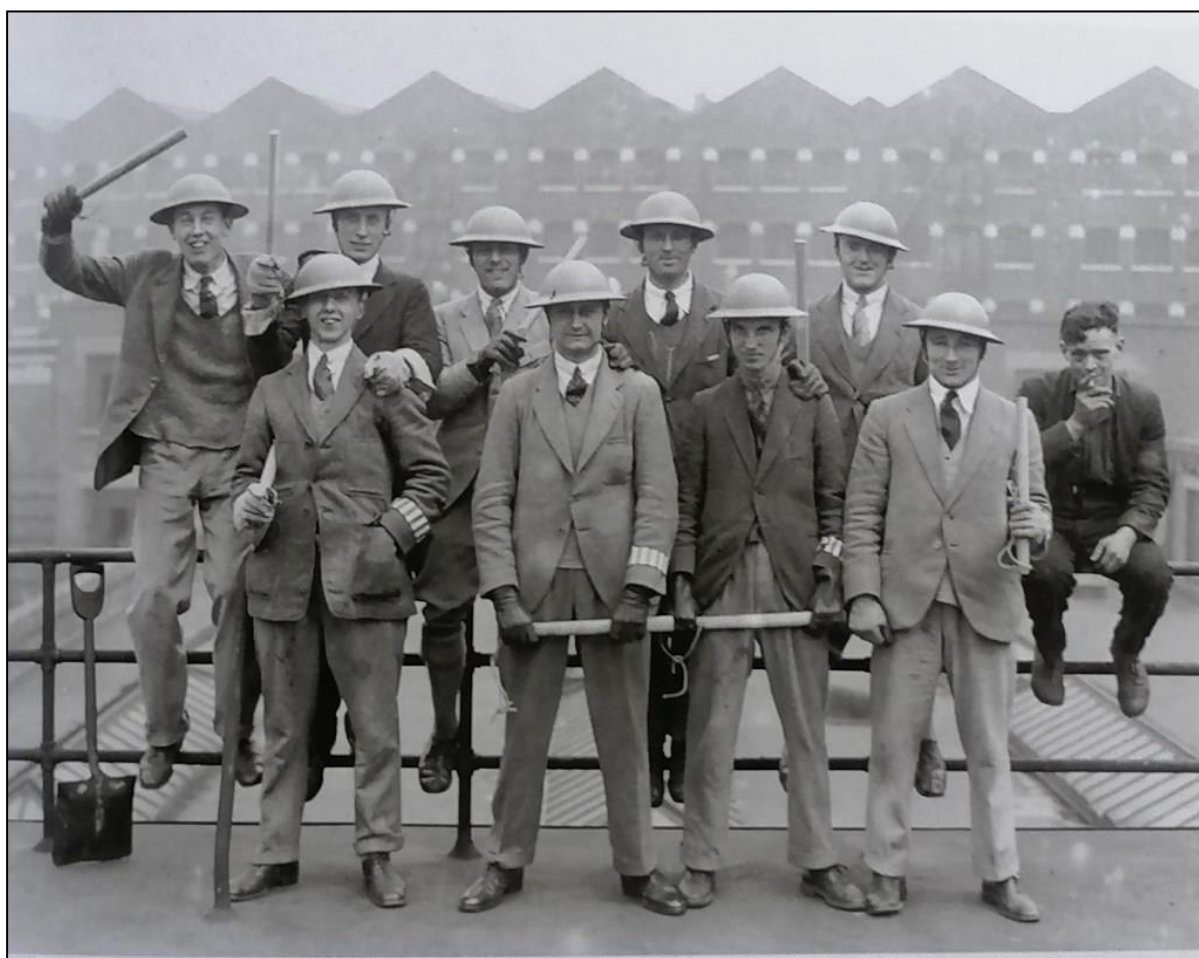
Studenti di Oxford prestano servizio volontario come ausiliari di polizia durante lo sciopero

La chiave per comprendere lo sciopero del 1926, il suo tiepido impegno e il suo spietato tradimento, è la burocrazia sindacale [...] in quanto freno alle lotte dei lavoratori [...]. Non si tratta semplicemente di denunciare il tradimento, che è fin troppo evidente. [...]