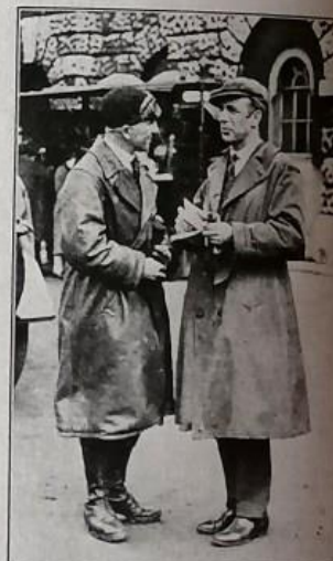
VISCOUNT CURZON INSTRUCTING A VOLUNTEER DESPATCH RIDER AT THE HORSE GUARDS PARADE.